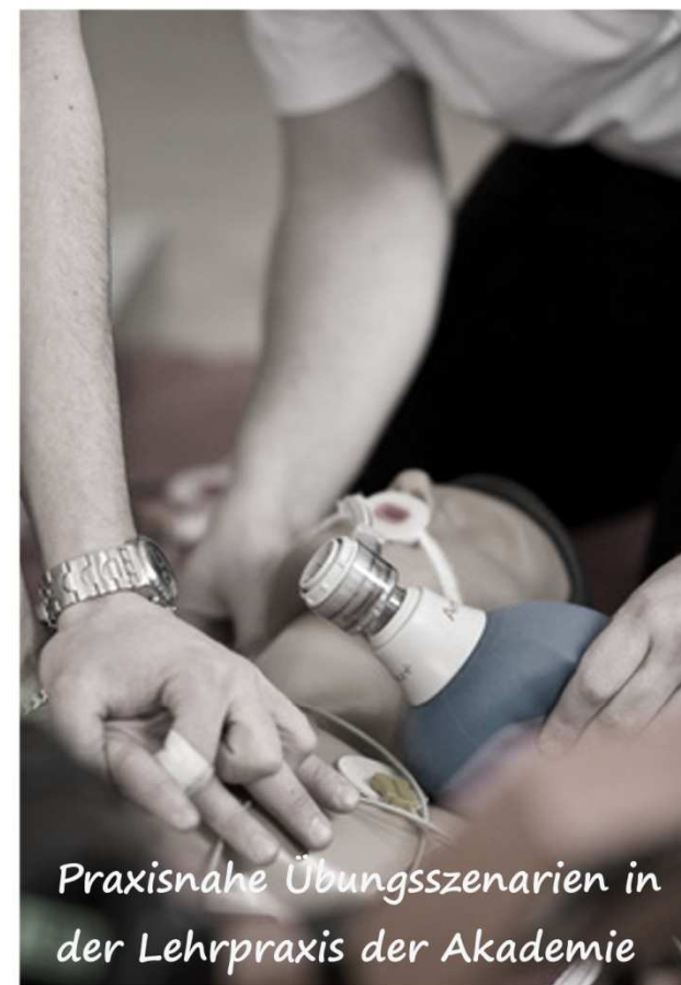
Praxisnahe Übungsszenarien in der Lehrpraxis der Akademie

Anrechnung: Die Veranstaltung wurde bei der Tiroler Zahnärztekammer zur Approbation eingereicht.